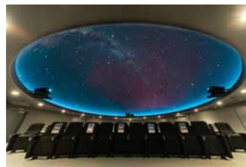
屋内スペースドームシアター（プラネタリウム）

展示室（1F）は、幅15m、高さ6mの大ビジョンを中心に、周囲の壁一面に長岡花火の歴史や魅力を紹介しているほか、原寸大の花火玉や花火の筒の展示など、見て学び。遊んで楽しむことができる施設です。ドームシアターは外部との遮音を考えて2階に配置し、高齢者・身障者・妊婦の方や小さなお子様連れも利用しやすいようにエレベーターを設置しました。