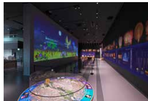
花火ミュージアム