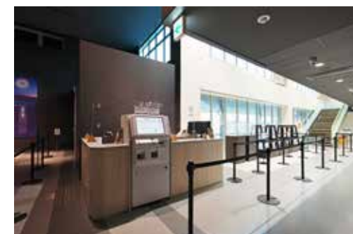
シアター受付とミュージアムショップ